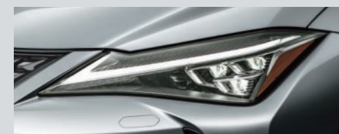
三眼フルLEDヘッドランプ(ロー・ハイビーム)& LEDフロントターンシグナルランプ+アダプティブハイビームシステム[AHS]+ヘッドランプクリーナー