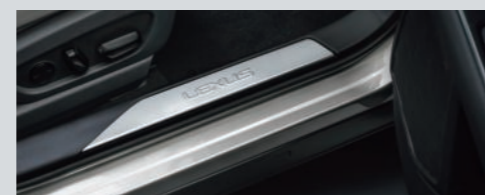
スカッフプレート (LEXUSロゴ付)