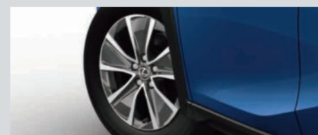
215/60R17タイヤ& エアロベンチレーティングアルミホイール(切削光輝+ミディアムグレーメタリック塗装)