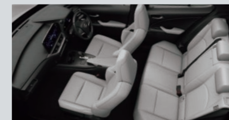
ホワイトアッシュ