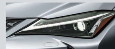
LEDヘッドランプ(ロー・ハイビーム)