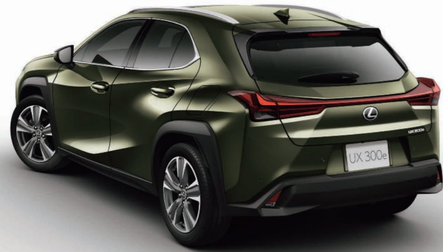
Photo:UX300e“version L”。ボディカラーはテレーンカーキマイカメタリック(6X4)。ルーフレールはメーカーオプション。