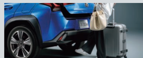
ハンズフリーパワーバックドア(挟み込み防止機能・停止位置メモリー機能付)