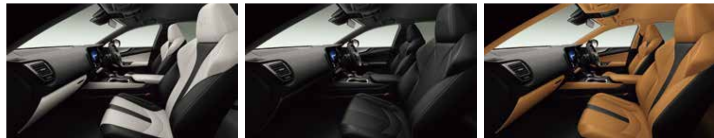
“F SPORT” ホワイト