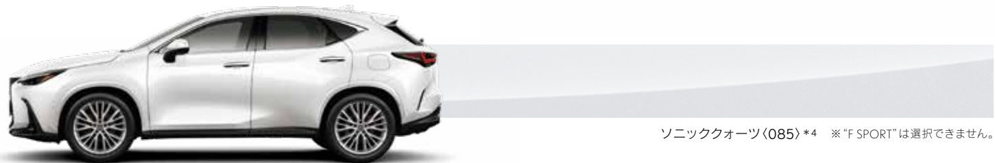
ソニックオーツ<085>*4 ※“F SPORT”は選択できません。