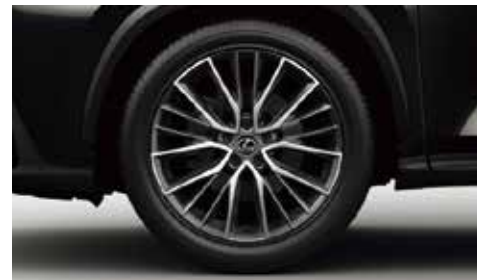
235/50R20ランフラットタイヤ & アルミホイール(ダークグレーメタリック塗装 + 切削光輝)