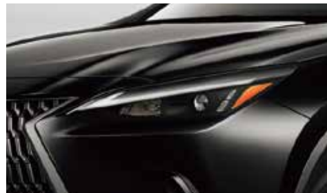
LEDヘッドランプ(ロー・ハイビーム) + オートマチックハイビーム [AHB]