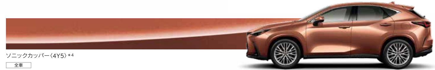
ソニックカッパー<4Y5>*4