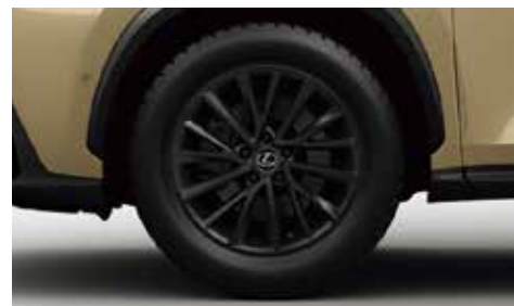
三眼フルLEDヘッドランプ(ロー・ハイビーム) + アダプティブハイビームシステム[AHS] + ヘッドランプクリーナー + LEDコーナリングランプ 235/60R18 103H“OVERTRAIL” オールテレンタイヤ & 18×7½J“OVERTRAIL”アルミホイール(マットブラック塗装) + パンク修理キット(スペアタイヤレス)