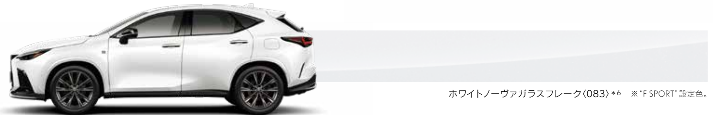
ホワイトノーヴァガラスフレイク<083>*6 ※“F SPORT”設定色。