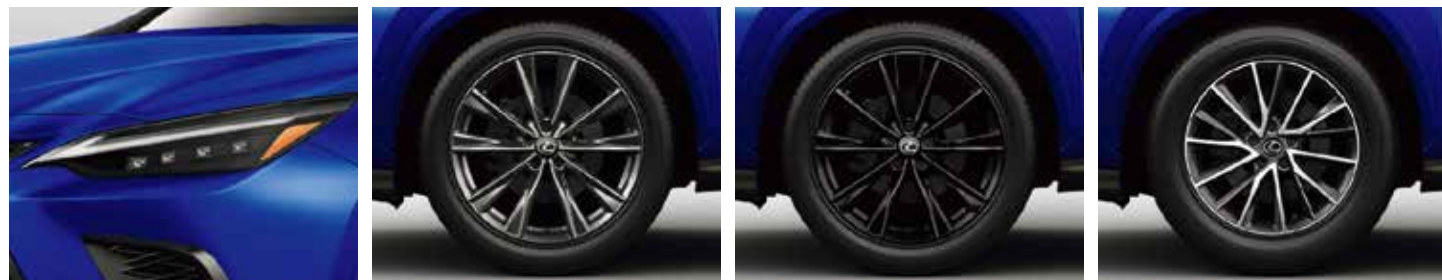
三眼フルLEDヘッドランプ(ロー・ハイビーム) + アダプティブハイビームシステム[AHS] + ヘッドランプクリーナー + LEDコーナリングランプ 235/50R20ランフラットタイヤ & “F SPORT” アルミホイール(スーパーグロスブラックメタリック塗装) *1*2 235/50R20ランフラットタイヤ & “F SPORT” アルミホイール(ブラック塗装) *1*2 235/60R18タイヤ & アルミホイール(ダークグレイメタリック塗装 + 切削光輝) + バンク修理キット(スペアタイヤレス) *3 NX450h+ NX350h NX350