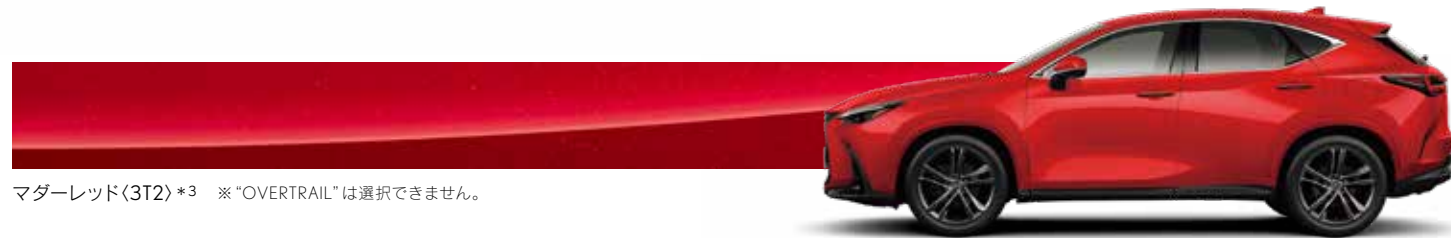
マダーレッド<3T2>*3 ※“OVERTRAIL”は選択できません。