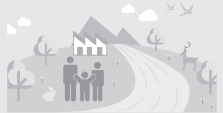
レクサス LX700h/LX600 環境仕様

レクサスは、水使用による環境負荷を小さくするとともに、生物の多様性を取り戻すために、自然保全活動の輪を地域・世界とつなぎ、そして未来へつなぐ活動を進めます。