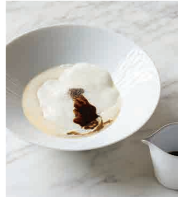
"NERIGASHI" ミルクの煉包み Nerigashi milk kneaded wrap

This is the fifth in a series of desserts developed by INTERSECT in partnership with Ginza Kazuya. Harnessing the rich tastes of Japanese bracken starch and milk, this unique INTERSECT kneaded dessert enwraps an aromatic, original vanilla ice cream that features a lavish amount of vanilla beans. The sauce is a hojicha honey original to INTERSECT and Ginza Kazuya, made from Kyoto Uji hojicha roasted green tea. Its harmony of superior sweetness and subtle sharpness is given a special accent of foil sugar.