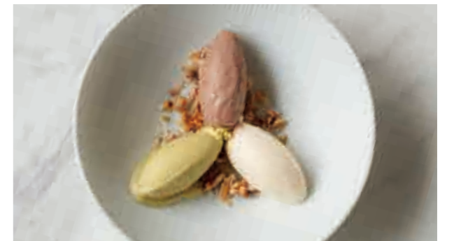
本日のアイス Today's ice cream