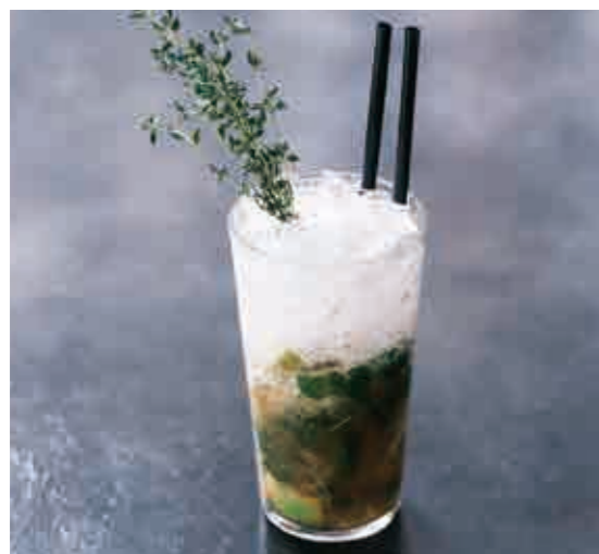
ラグジュアリー モヒート Luxury mojito