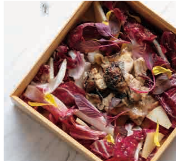
大山鶏のコンフィと赤いサラダ、りんごと生姜のヴィネグレット Chicken confit with red vegetables salad and apple ginger dressing