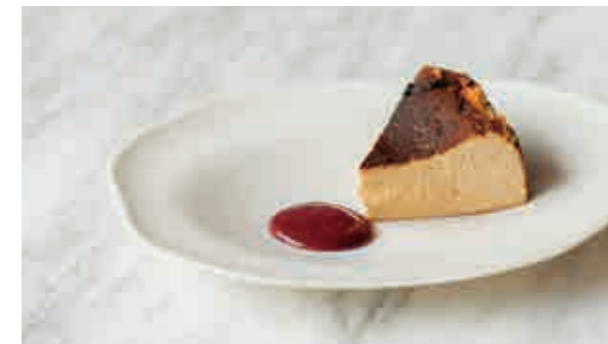
熟成酒粕のバスクチーズケーキ Sake lees basque cheese cake