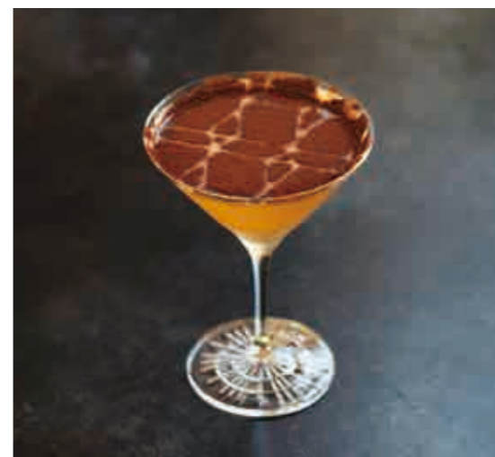
スピンドル エスプレッソ マティーニ SPINDLE espresso martini