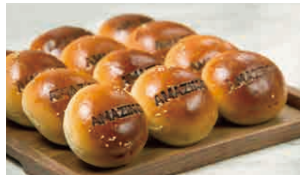
AMAZING あんぱん -クリームチーズ- AMAZING ANPAN 380

デニッシュ生地にシナモンを巻き込んで焼き上げました。シナモンとチョコフォンダンの風味、チョコクランチの食感をお楽しみいただけます。