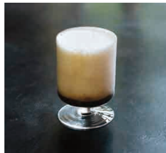
ほうじ茶ラムミルク Hojicha rum milk