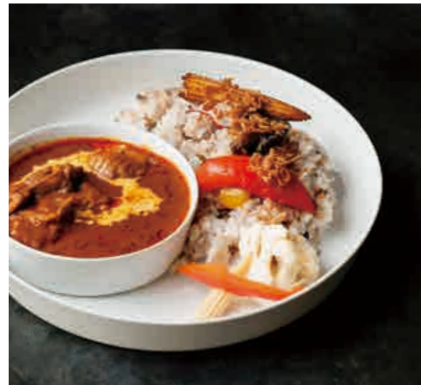
チキンカレーライス Chicken curry & rice