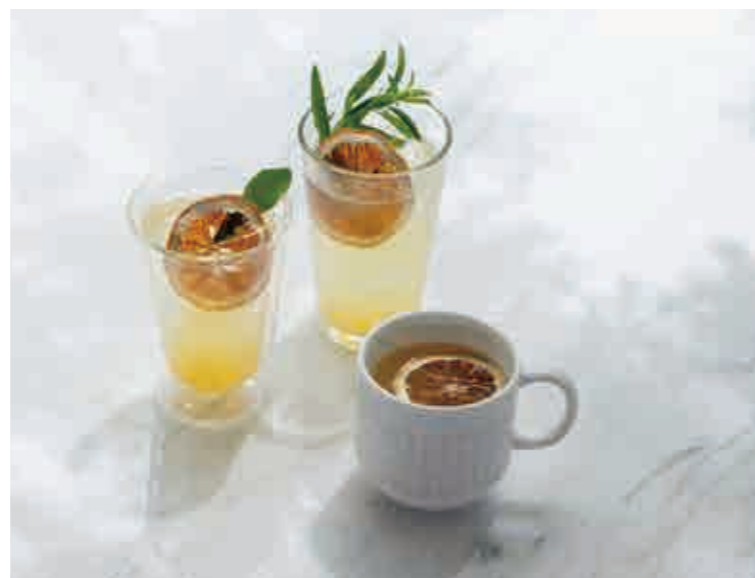
クラフテッド アイス レモネード / クラフテッド レモンスカッシュ Crafted Iced lemonade / Crafted lemon squash クラフテッド ホット レモネード Crafted hot lemonade