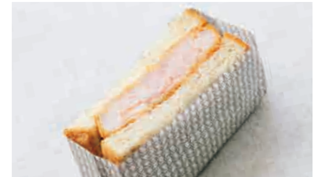
エビカツサンド Shrimp cutlet sandwich 700

スモークサーモンの深い味わいと、なめらかなクリームチーズを使った「銀座ミルク食パン」でサンドしたサンドイッチです。