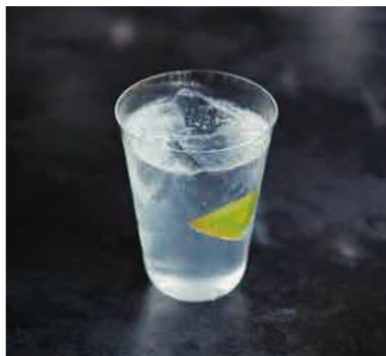
自家製ビターズ薫るジントニック Homemade bitters gin tonic