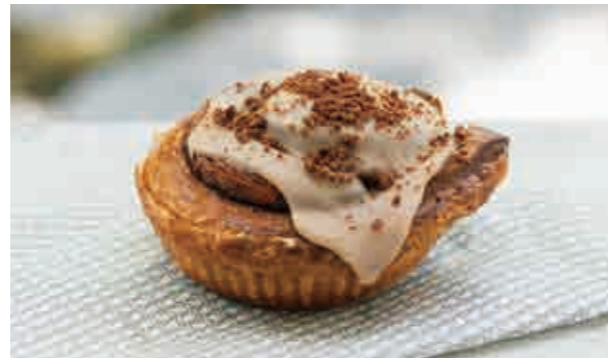
シナモンデニッシュ Cinnamon danish 450

クロワッサン生地で自家製アップルシナモンフィリングを包んで焼き上げ、中にはカスタードクリームを贅沢に詰め込みました。生地サクサク感とクリームのとろける風味が特徴的です。