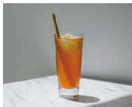
クラフテッド コーラ Crafted cola