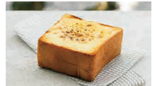
チーズトースト Cheese toast 550

芳醇なバター香り、クロワッサン特有の折り込みパイ生地のサクサク感で外はパリッと、中はふんわり。甘くなく、ほんのリバターの塩味が飽きずに食べられちゃうクロワッサンです。