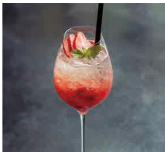
フレッシュ ストロベリー ロワイヤル Fresh strawberry royale