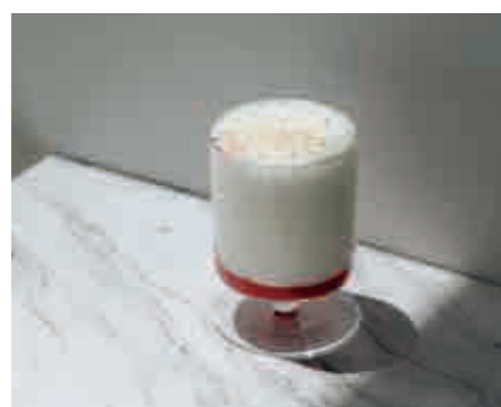
いちごみるく Ichigo milk