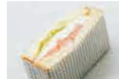
サーモンとクリームチーズサンド Salmon and cream cheese sandwich