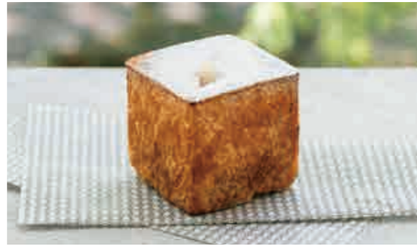
林檎とカスタードのキューブ Cube of apple and custard 470

クロワッサン生地で自家製アップルシナモンフィリングを包んで焼き上げ、中にはカスタードクリームを贅沢に詰め込みました。生地サクサク感とクリームのとろける風味が特徴的です。