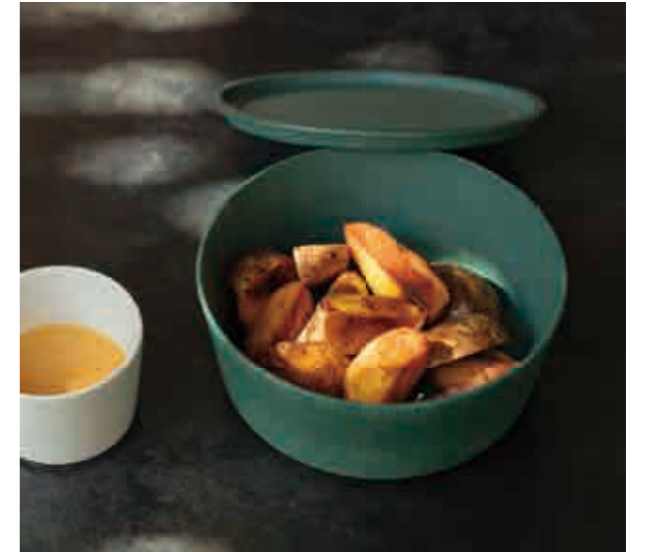
ポムフリット Fried potato