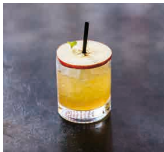
シャイ アップル Shy apple