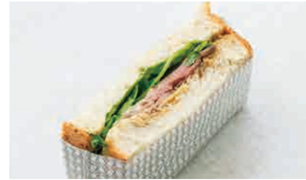
ローストビーフサンド Roast beef sandwich 700

スイートコーンをたっぷり使い、ふんわりソフトなパンでつつんだコーンパン。割ると中からあふれ出てくるコーンの量に驚くはず。ちょっと温めて、コーンの甘さを噛みしめてみてください。