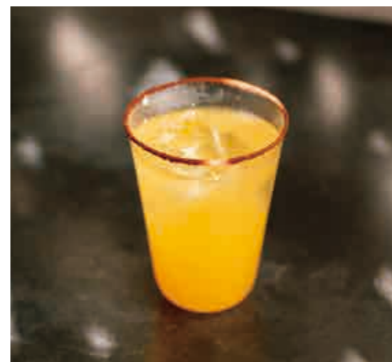
発酵無発酵フィズ Fermentation non fermentation fizz