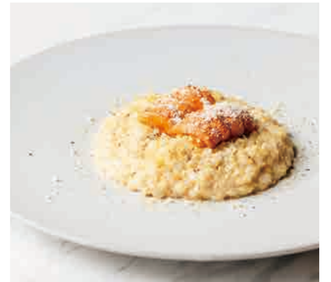
本日のリゾット Today's risotto