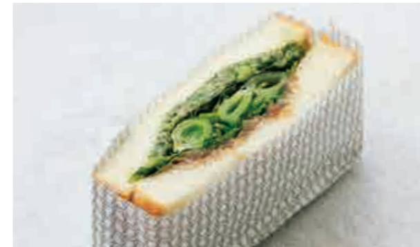
野菜のサンド Vegetable sandwich 700

ジューシーなローストビーフに、熟成されたコンテチーズと爽やかな辛味のホースラディッシュが旨味を引き立たせるサンドイッチです。