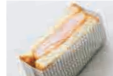
エビカツサンド Shrimp cutlet sandwich

サンドイッチセットをご注文の方は、下記ドリンクをセット価格にてご利用いただけます。 Drinks with sandwich set are served at a special price.