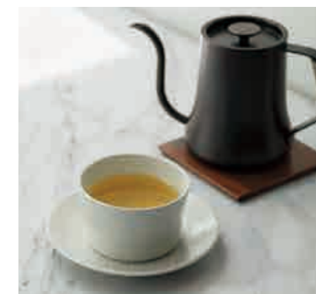
白ほうじ茶 Roasted green tea