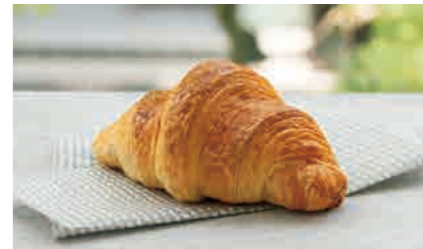
クロワッサン Croissant 320

新鮮な小エビを贅沢に使い、サクッと軽い衣を纏わせたプリプリの食感。ほど良い酸味を効かせた特製のアメリカーナソース。「銀座木村家」で長年愛される人気の定番サンドを、ヘルシーなライ麦パンでご提案する当店限定のサンドイッチです。