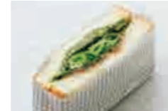
野菜のサンド Vegetable sandwich