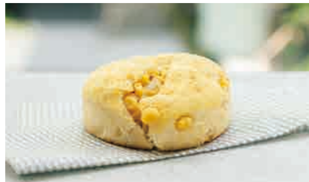
たっぷりコーンパン Cone bread 390

きびきびとした走りと操舵性の高さが魅力のLEXUS IS。その走りの魅力を表現し話題となったCM「Undokai」篇の中で登場したAMAZINGあんぱんを完全オリジナルで開発。餡子の絶妙な甘さの中にクリームチーズの爽やかな酸味を効かせ、味にもデザインにもこだわった特製あんぱん。ここでしか入手できない一品です。