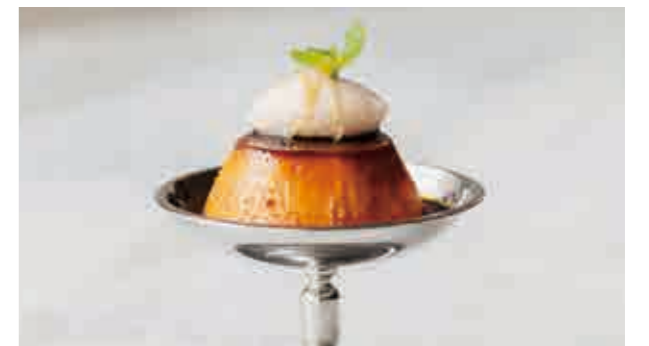
かぼちゃプリン Pumpkin pudding