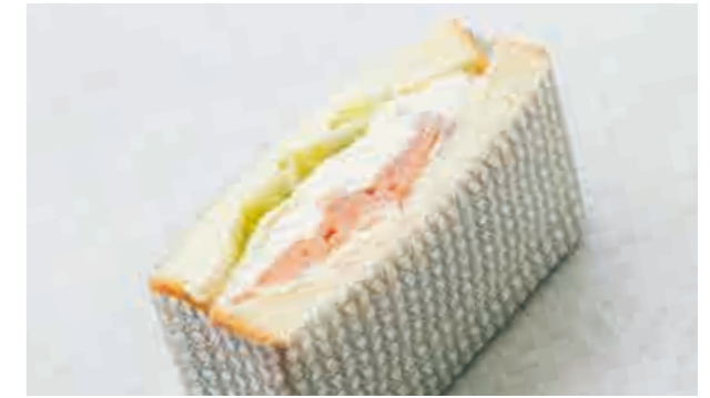
サーモンとクリームチーズサンド Salmon and cream cheese sandwich 700

新鮮な3種のグリーンを豆乳と野菜の自家製ベシャメルソースと融合。あめ色に炒めてバルサミコ酢と合わせた特製「オニオンソース」と共に、「銀座木村家」伝統の酒種を使った「銀座ミルク食パン」でサンド。シェフズサラダ感覚の贅沢なサンドイッチです。