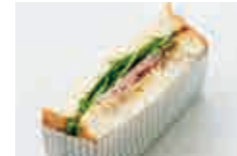
ローストビーフサンド Roast beef sandwich

サンドイッチ : 右上の4種からお1つお選びください。 Sandwich : Please select one from the right.