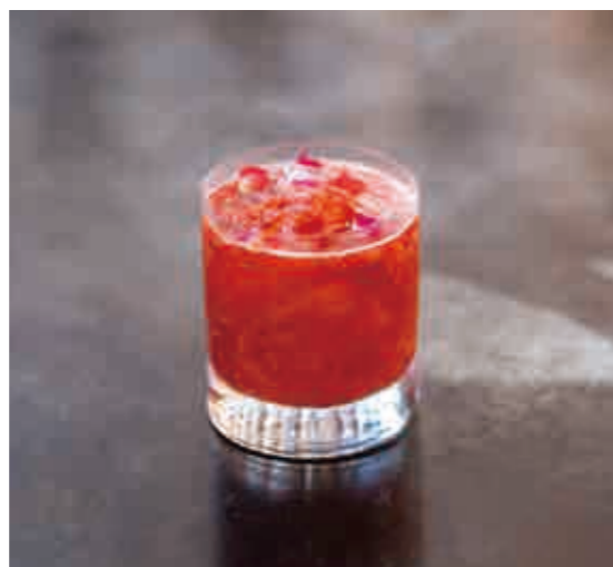
ロツソ ロツソ ロツソ! Rosso rosso rosso!