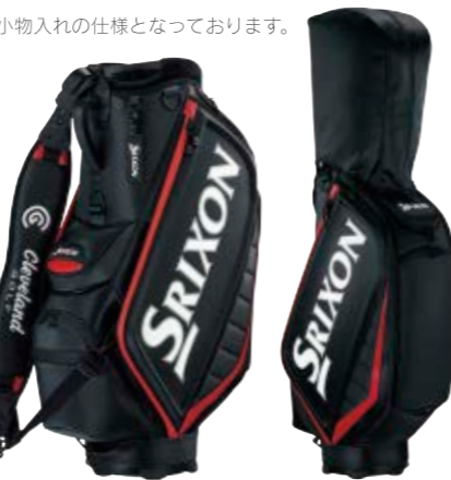
ブラック 01LXM10204 70,000円(税込)