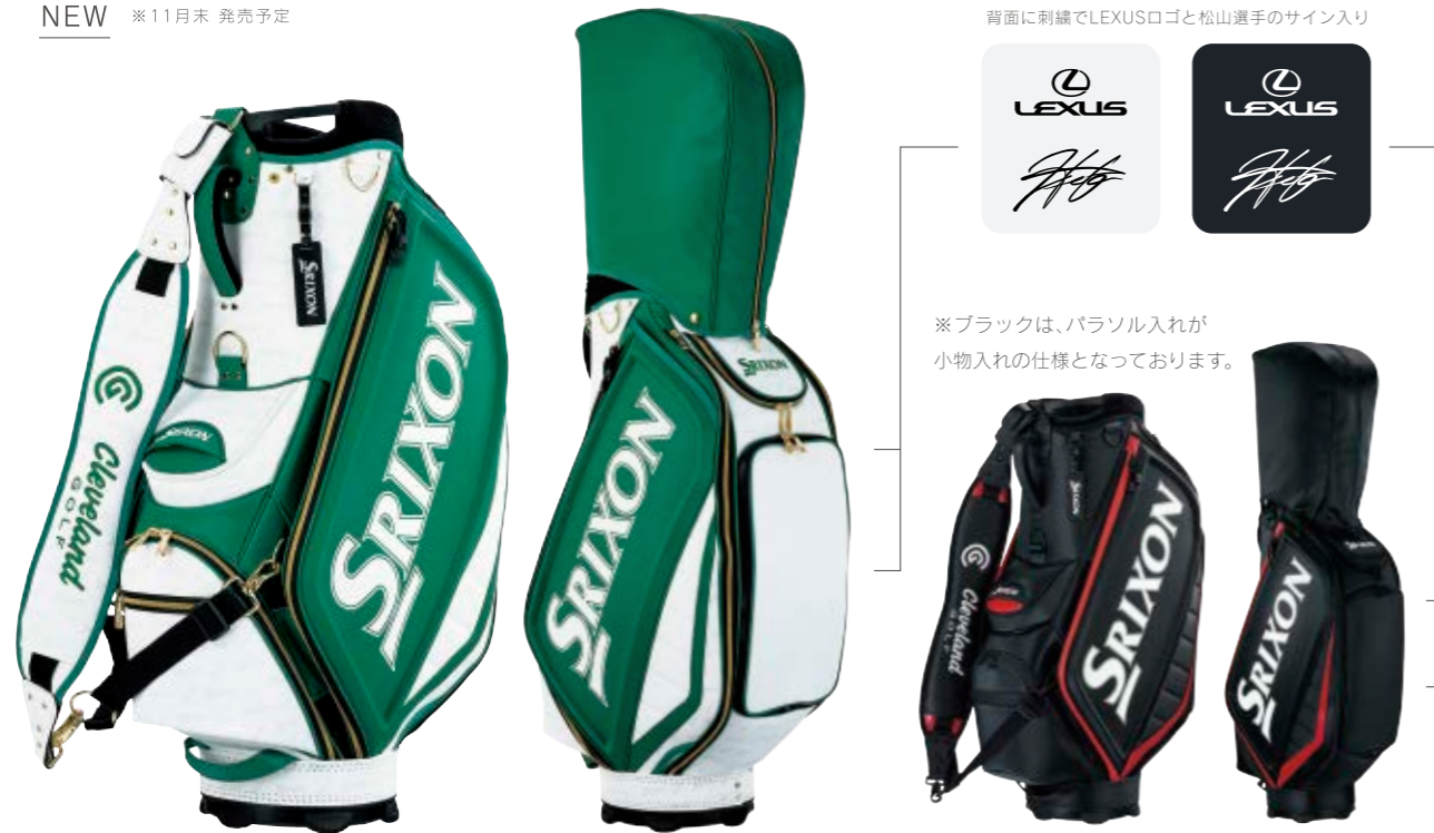
グリーン×ホワイト 01LXM10243 122,000円(税込)